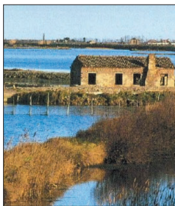
CONVEGNO Sul Contratto di Foce