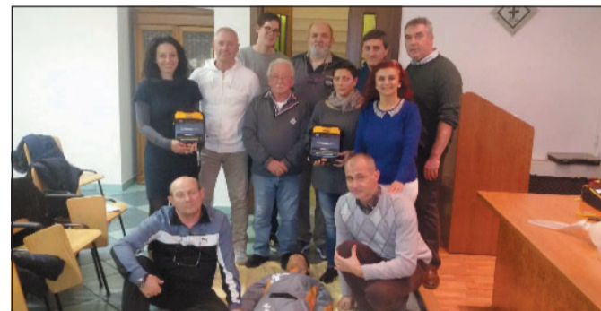
AUSER Il gruppo Auser impegnato nel corso sul defibrillatore

Defibrillatore al Palazzetto grazie all'associazione Auser